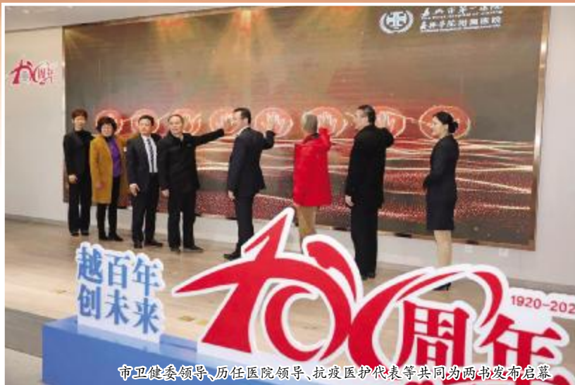
市卫健委领导、历任医院领导、抗疫医护代表等共同为两书发布启幕