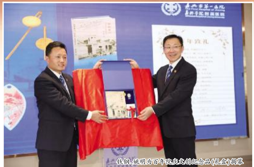
钱钢、姚明为百年院庆文创纪念品(礼盒)揭幕